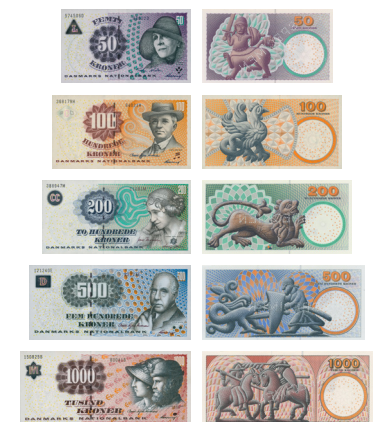
1997 Inuup assingi aamma oqaluffinni eqqumiitsuliat