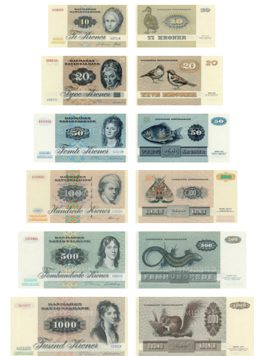
1972 Inuup assingi aamma uumasut