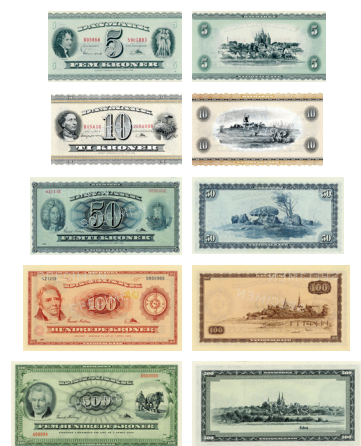
1952 Inuup assingi aamma pinngortitameersut