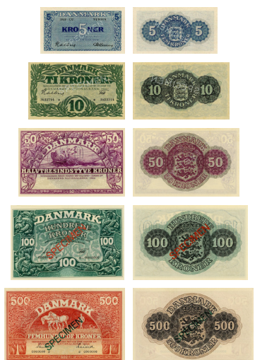
1944 Tullerriiat taarserneqartussat